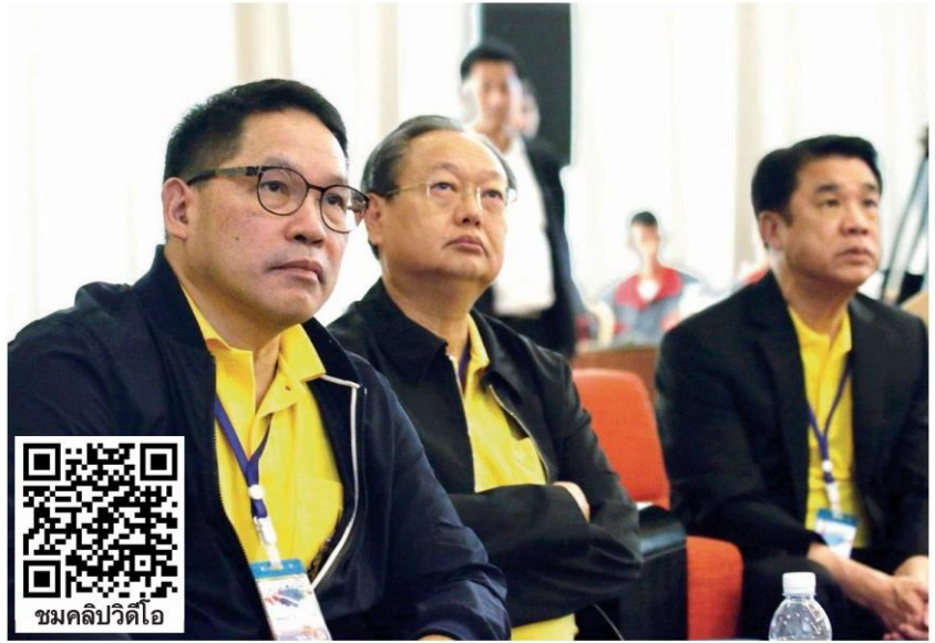
‘พปชร.ตีว’ - นายอุตตม สาวนายน หัวหน้าพรรคพลังประชาชน (พปชร.) พร้อมแกนนำพรรคร่วมสัมมนา ส.ส.ของพรรคเพื่อเตรียมตัวก่อนเข้าทำงาน ในสภา ทั้งนี้ นายอุตตมมั่นใจว่าจะได้จัดตั้งรัฐบาล ที่โรงแรมเดอะ ซายน์ เมืองพญา จ.ชลบุรี เมื่อวันที่ 14 พฤษภาคม

พล.อ.ประยุทธ์กล่าวว่า วันนี้เราทำอะไร ก็ได้ อย่างนั้น ไม่ว่าจะเขียนเพชฌัญหรือโซเซียล ให้รุนแรงหรือไม่รุนแรง จะชมหรือว่ากันไป มา แต่ไม่มีประโยชน์อะไรกับประเทศทั้งสิ้น อย่างไรก็ตาม ในการเดินหน้าสู่ประชาธิปไตย ทุกคนคาดหวังว่าเราจะมีรัฐบาลที่ทำเพื่อ ประชาชนอย่างแท้จริง และเมื่อได้รับการ