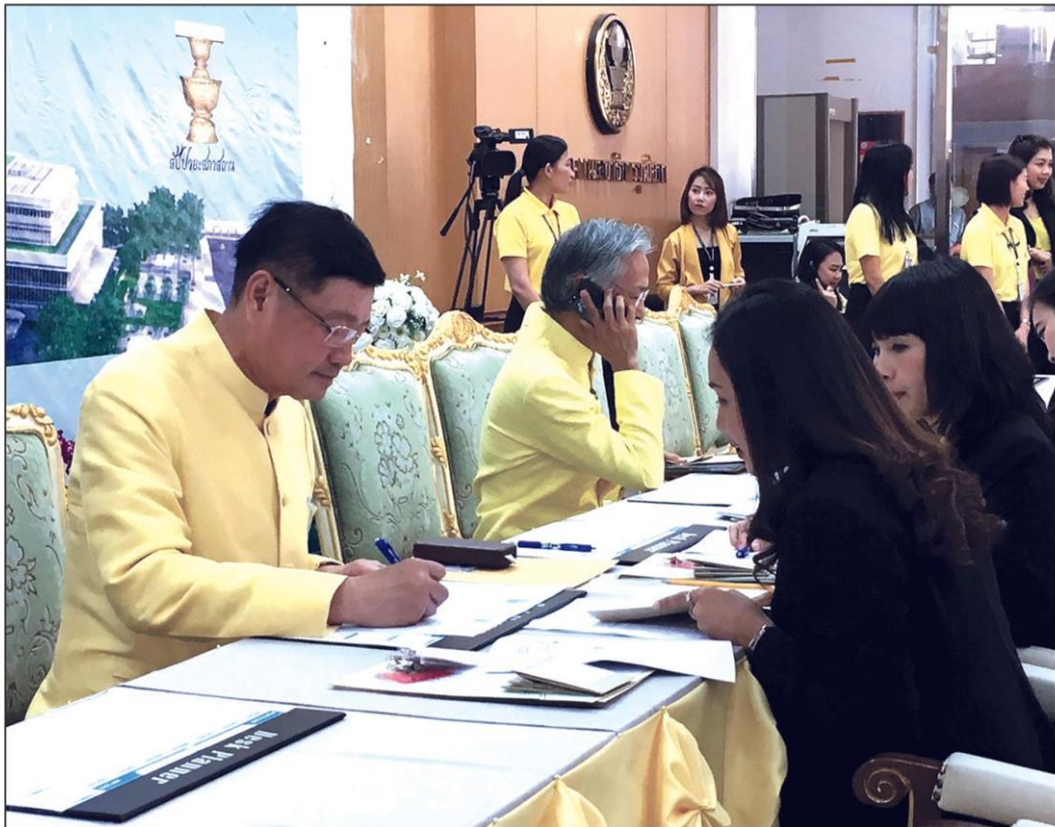
▲ รายงานตัว : นายพีระศักดิ์ พอจิต อดีตรองประธานสภานิติบัญญัติแห่งชาติ (สนช.) คนที่ 2 พร้อมด้วยนายวัลลภ ตังคณานุกาญจน์ อดีตสมาชิก สนช. เดินทางเข้ารายงานตัวการเป็นสมาชิกวุฒิสภา (สว.) ภายหลังมีพระบรมราชโองการประกาศแต่งตั้ง ที่สำนักงานเลขาธิการวุฒิสภา