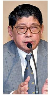
วิษณุ เครืองาม

'วิษณุ' เผยจัดพิธีเสด็จไปทรง เปิดสภา 24 พฤษภาคม หลัง ประกาศชื่อ 250 ส.ว.แล้ว รุม ลับแต่ตั้งเครือญาติ พปชร. ได้เพียบ-ตำรวจ-ทหารพริบ กว่าร้อยอดีต สนช.-สปท. 89 คน รวม 18 อดีต รมต.ด้วย 'วันนอร์' ชูโหวตเลือก'บิ๊กตู' อาจพิดม.114 'อุตตม' ติวเข้ม 115 ส.ส. (อ่านต่อหน้า 10)